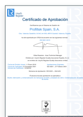
ISO 9001:2015 Système de gestion de la qualité