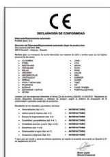
UNE-EN 14428:2016 Parois de bain